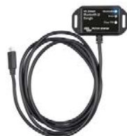
VE.Direct Bluetooth Smart Dongle (separat zu bestellen)

Eine zu hohe oder zu schwache Batteriespannung wird durch einen akustischen und einen visuellen Alarm sowie durch ein Relais für eine Fernanzeige signalisiert.